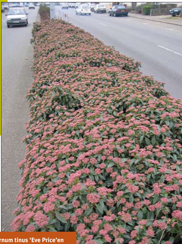
Viburnum tinus 'Eve Price' en terre-plein central.

De tous les espaces urbains à aménager, les bandes axiales ou laté-