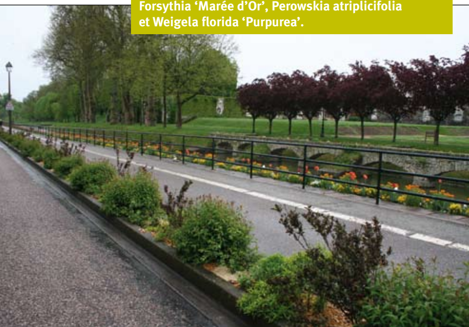
Association de Spiraea x bumalda 'Anthony Waterer', Forsythia 'Marée d'Or', Perowskia atriplicifolia et Weigela florida 'Purpurea'.

est parfois dicté par des contraintes d'ordre organisationnel totalement en inadéquation avec le cycle de végétation et de floraison des arbustes ou par des difficultés de mise en œuvre d'une signalisation de chantier temporaire.