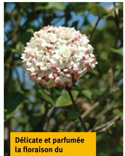
Délicate et parfumée la floraison du viburnum carlesii .

Pour ne pas avoir à les tailler et conserver leur port naturel, plantez-les en respectant leur diamètre et leur hauteur.