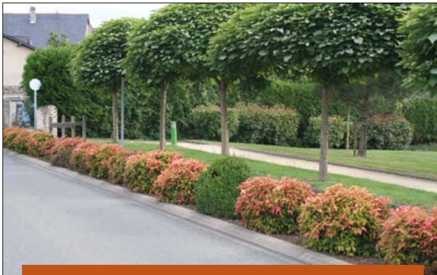
Nandina domestica 'Firepower' et Buxus sempervirens. Au-delà de toute considération esthétique, forcément très subjective, les plantes de ces deux massifs sont parfaitement adaptées à l'utilisation qui en est faite. Une taille hivernale raisonnée est effectuée sur le massif de gauche. A droite, seuls les buis sont taillés régulièrement.

rond» urbain aux grands échangeurs circulaires, il est dorénavant possible de rencontrer toute la panoplie ! L'agencement paysager des grands giratoires répond aux mêmes règles que les accompagnements extérieurs de voiries et pause rarement de gros problèmes de promiscuité avec les véhicules. En revanche, il n'en est pas du tout de même dans l'aménagement des petits giratoires urbains ou de leurs abords, trop souvent maltraités à cause d'un mauvais choix de végétaux.