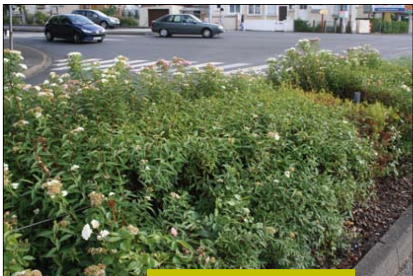
Spiraea japonica 'Genpei' en terre-plein central. Les plantes sont parfaitement adaptées à l'utilisation qui en est faite, mais aucune raison ne peut justifier qu'une taille soit effectuée début juillet, en pleine floraison... et sur une partie seulement du massif (photo effectuée 2 semaines environ après l'intervention !).

Où se trouve l'intérêt d'une bande latérale traitée de la sorte ? Dès la fin de l'été et jusqu'au début du printemps, les plantes offriront ce spectacle affligeant ! Quel que soit le type d'entretien voulu, aucun miracle ne sera possible : la plus grande proportion de cet aménagement est constituée de Deutzia scabra , poussant allègrement à 2 m de hauteur et fleurissant sur les bois d'un an et plus. Toute velléité de voir fleurir ces malheureux massifs sera vaine.