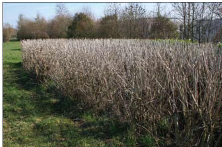
Quelle logique peut expliquer le fait que ce Salix purpurea 'Gracilis' soit taillé en boule ou que ce grand massif de Viburnum opulus longeant une 4 voies en rase campagne soit taillé de la sorte ? Certainement pas la recherche de l'esthétique, pas plus le souci de l'économie !