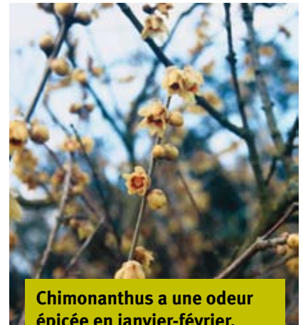
Chimonanthus a une odeur épicée en janvier-février.

Viburnum davidii est acrotone mais sa croissance est lente et son développement relativement faible. Ces sujets, en place depuis deux saisons n'engendrent encore aucun entretien et leur port reste naturel. Cependant, dans quelques années, il faudra intervenir pour réduire, contenir le volume... ou changer les plantes.