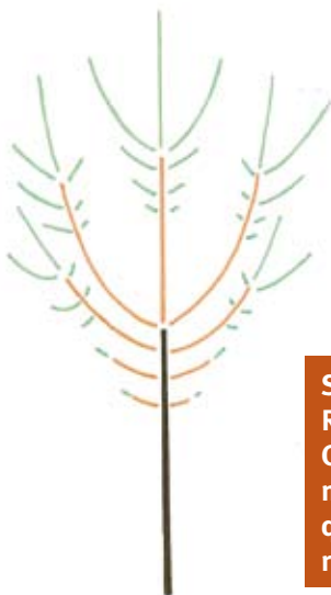
Schéma d'un végétal acrotone (d'après Raimbault et Chartier 1990). Chaque année, la plante produit de nouvelles pousses d'autant plus vigoureuses qu'elles sont proches de l'extrémité des rameaux de l'année précédente.

C'est le principe par lequel une plante développera chaque année ou presque, à partir de la base des rameaux ou directement sur la souche, des ramifications dont la vigueur sera d'autant plus importante qu'elles seront proches de la base des rameaux (basitonie de rameau) ou de la souche (basitonie de souche). Plus les ramifications sont proches de la base, plus elles sont vigoureu-